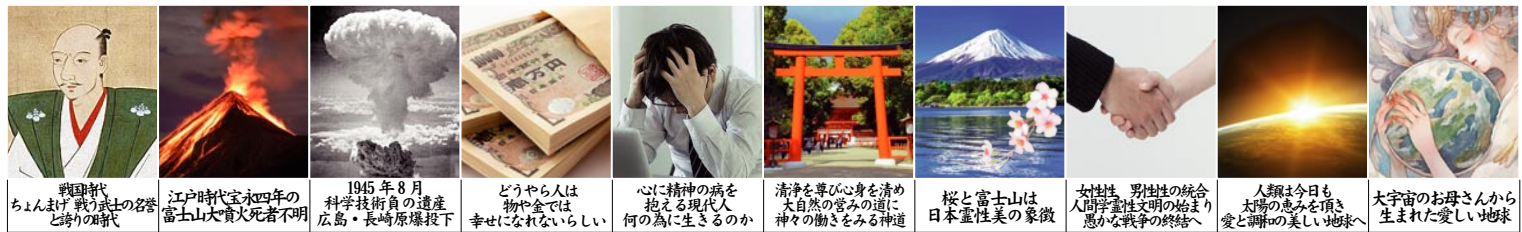
戦国時代 ちょんまげ 戦い 武士の名誉 と誇りの時代 江戸時代宝永四年の 富士山大噴火 死者不明 1945年8月 科学技術負の遺産 広島・長崎原爆投下 どうやら人は 物や金では 幸せになれないらしい 心に精神の病を 抱える現代人 何の為に生きるのか 清浄を尊び心身を清め 大自然の営みの道に 神々の働きをみる神道 桜と富士山は 日本霊性美の象徴 女性、男性の統合 人間性文明の始まり 悪から戦争の終結へ 人類は今日も 太陽の恵みを頂き 愛と調の美しい地球へ 大宇宙のお母さんから 生まれた愛しい地球

合成がなされてきました。私たちの前に今広がっているような自然界を作り上げ、必然的に生命が存在出来るような形に物理量が決まっているなど、偶然に生じたとはとても思えません。宇宙には前もって定められたデザインや原理のようなもの「宇宙意志」があると思えます。霊性について考える事は「いのち」について考える事でもあり、霊性＝「いのち」とも言えると思えます。大宇宙そのものも、一つの生命として活動していると考えられ、人間は約 60 兆個の細胞から出来て一系乱れず、法則のもとに生命活動をしているおかげで私たち一人ひとりの人間のいのちがこの世に生まれ、現れ出てきます。これと同じように、大宇宙のいのちは太陽や地球が一つの生命体として、大宇宙に生まれ、現れ出ていると言えます。過去から未来まで、永遠の宇宙に存在するあらゆるものを賞き働き、この大なる者こそ、「霊性」と言えます。日本的霊性は、自然を心の中に見出し、より高次の豊かな美しき霊性心の人々を目醒めさせました。誰の中にもある美しい霊性心の目醒めをもう一度見直し、本当の自分に出逢う時が来ています。今年の酷暑も酷かったですが、来年はもっとも酷くなると言われています。環境破壊も来るところまで来ました。今や人類の危機すら予感させるところまで来ています。具体的に克服できる道を探り、道を開き、努力していきたい。いよいよ一人一人の人類の意識の目醒めにかかっています。「霊性文明の夜明け」に向かい、みんなで考え、何を行動し、伝えていくのか、各界の先生方にお話しいただきます。