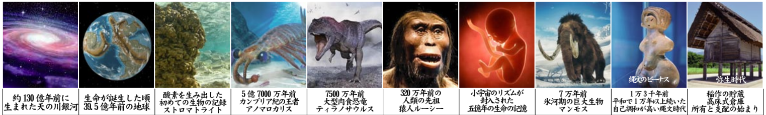
約130億年前に生まれた天の川銀河 | 生命が誕生した頃 38.5億年前の地球 | 酸素を生み出した初めての生物の記録 ストロマライト | 5億7000万年前カンブリア紀の王者 アノマロカリス | 7500万年前大型肉食恐竜 ティラノサウルス | 320万年前の人類の先祖 猿人ルーシー | 小宇宙のリズムが封入された五億年の生命の記憶 | 7万年前氷河期の巨大生物マンモス | 1万3千年前平和で1万年以上続いた自己調和が高い縄文時代 | 稲作の貯蔵高床式倉庫 所有と支配の始まり

人間のような生命が存在出来る為には宇宙の進化の過程の中で星々が形成され、生命が必要とする様々な元素の融合があり