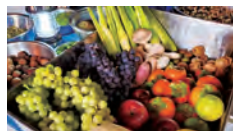
机一杯の酵素材料