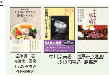
塩澤研一著 帯津良一監修 1,725円税込 PH-P研究所 中川奈美著 塩澤みどり監修 1,510円税込 原書房