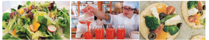
お野菜たっぷりサラダ 無農薬人参ジュース 絶品!!フォカッチャ