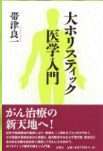
帯津良一著 春秋社