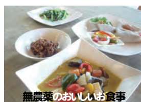
無農薬のおいしいお食事