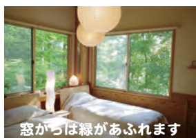
窓からは緑があふれます