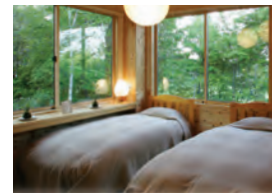
館内は清潔第一です