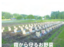
霜から守るお野菜

主催・申込み・問い合わせ 公益財団法人いのちの森文化財団 いのちの森の学校 青少年育成公開講座