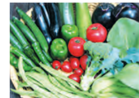
無農薬野菜の手作り料理