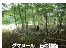
ダマヌール 石の螺旋