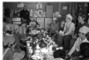
ボランティアミーティング