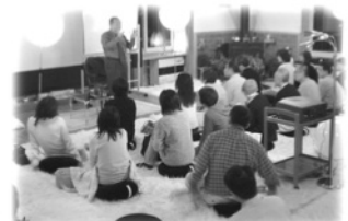
セミナー講師ボランティア