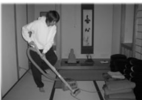
そうじボランティア