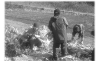
野沢菜取りと漬け物ボランティア