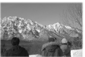
自然観察ボランティア