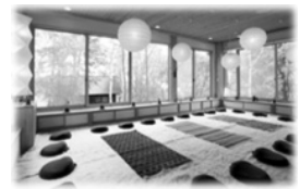
グリーンオアシス