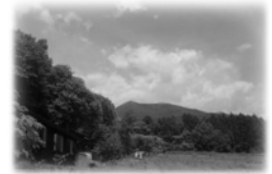
飯縄山を臨む 左は水輪