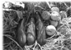
野菜収穫ボランティア