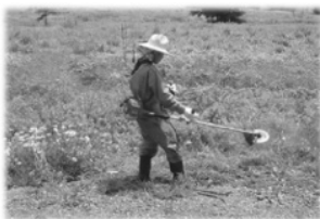
草刈りボランティア

この地球のために役に立ちたい、環境を守り、苦しむ人々の力になりたい。あなたの想いは自宅に居ても実践出来ます。私たちのいのちをはぐくみ育てる活動を自宅で支えてくださることは、社会貢献、地球貢献につながっていきます。