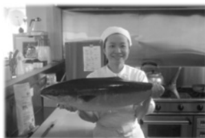
調理補助ボランティア