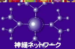
神経ネットワーク