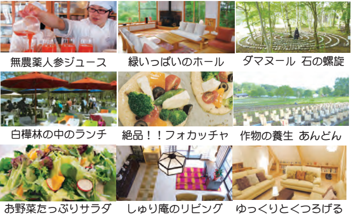
無農薬人参ジュース 緑いっぱいホール タマヌール 石の螺旋 白樺林の中のランチ 絶品!!フォカッチャ 作物の養生 あんどん お野菜たっぷりサラダ しゅり庵のリビング ゆっくりとくつろげる

いのちの森の大自然のエネルギーは、心と体を癒し、自然治癒力を高めます。隣接する水輪ナチュラルファーム自然農園では農薬や化学肥料を一切使用せず野菜を作り、環境と健康に配慮した農法を行っています。大切に保護された自然は、やどりぎや銀竜草など高山植物、また山野草の宝庫です。館内寝具類は清潔を保ち、施設には和紙の照明、建物は天然木の檜や杉材を使用することで、人工的な建材によって遮断されることなく大自然のそと登んだ空気を、十分に味わうことができます。厳選された無添加の食材・調味料、無農薬野菜などを使った心のこもった美味しい食事は、心身をリフレッシュしてくれます。