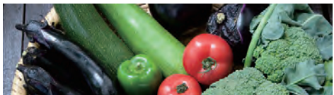
自然農園のお野菜たち