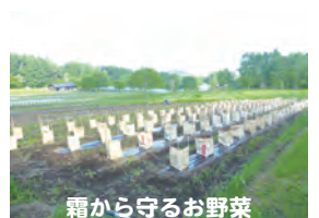
霜から守るお野菜

主催・申込み・問い合わせ 公益財団法人いのちの森文化財団 いのちの森の学校 青少年育成公開講座