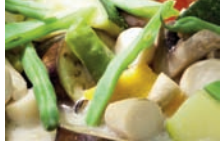
無農薬野菜の料理