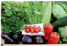
無農薬のお野菜達