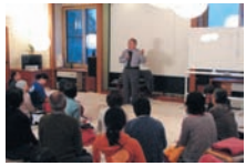
わかりやすい講義