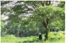
心やすらぐ自然の中で