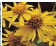
アルニカ・モンタナ