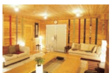
くつろげる図書室