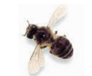
アピス・メフィリカ