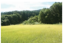
お米も無農薬で育てます

1日目 12:00 受付開始 13:00 朝エンターション ・自己紹介 15:00 入浴・温泉 18:00 夕食(特製健康養生食) 19:00 帯津先生講義I 生老病死のホメオパシー 20:00 帯津先生 「ホメオパシー講演」 ビデオ学習