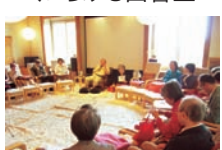
何でもご質問下さい