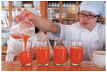
名物にんじんジュース