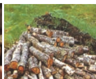
カルボヴェゲタピリス