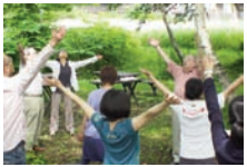
白樺林で樹林気功