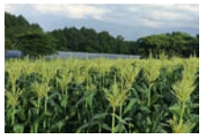
自然農園もろこし畑

3日目 9:00 帯津良一先生指導 樹林気功「時空」 10:00 朝食(特製健康養生食) 11:00 帯津先生講義III 生老病死のホメオパシー 車座なんでも相談Q&A 2回目 14:10 終了 乗り合いタクシー出発