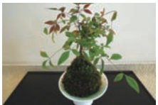
いたる所にある「こけ玉」