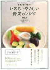
塩沢研一著 帯津良一監修 1,680円税込 PHP研究所

左「心と体を強くする養生365日」は養生塾11年間の記録をまとめた帯津先生の著書。右「いのちにやさしい野菜のレシピ」は養生塾の免疫力を高めるレシピが満載。共に帯津先生ご推薦の著書。本に関する質問も受付。