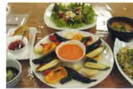
畑の無農薬野菜のお食事