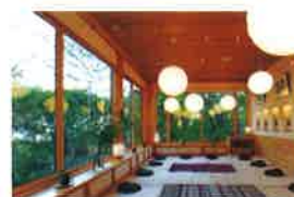
緑に囲まれた会場