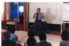
楽しい特別講演会