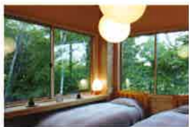
緑に囲まれた清潔な客室