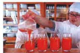
水輪名物こんしんジュース