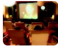
⑦ヒーリングシアター