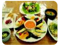
⑩すべて手作り料理