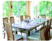
⑬緑に囲まれた食堂