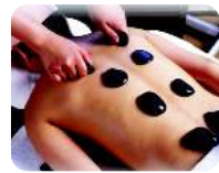
⑪癒しのセラピー体験