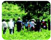
⑥さわやか農園散策