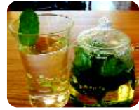
③摘みだてハーブティー