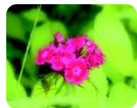
⑯畑に咲いている花