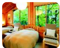
⑫緑と杉と檜の客室