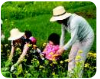
⑭お野菜もぎとり体験