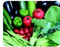
①朝採り野菜を朝食に