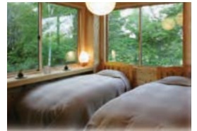
館内は清潔第一です