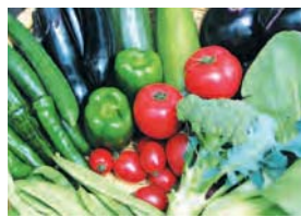
採れたてお野菜をお出します