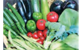
無農薬野菜の手作り料理