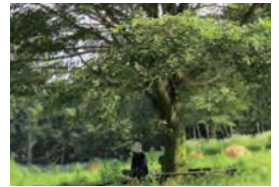
内観で自分と向き合う