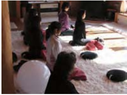
座禅の呼吸法を知る