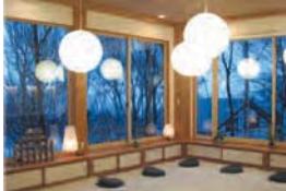
癒しの空間が広がります