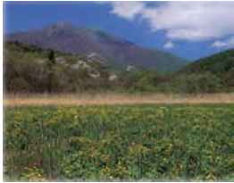
大自然に囲まれた環境