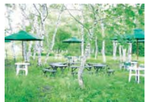
白樺林のガーデンスペース