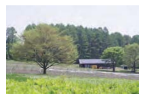
隣接している5町歩の自然農園

主催・申込み・問い合わせ 公益財団法人いのちの森文化財団 いのちの森の学校 青少年育成公開講座