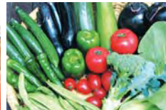
畑の朝採り野菜の食事