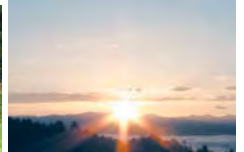
農園からの絶景 朝日