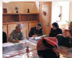
わかりやすい講義