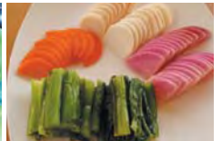
漬物もすべて手作り