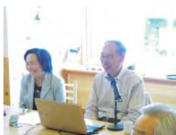
久間先生に何でも質問OK