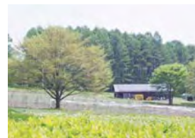
隣接した5町歩の自然農園

主催・申込み・問い合わせ 公益財団法人いのちの森文化財団 いのちの森の学校 青少年育成公開講座