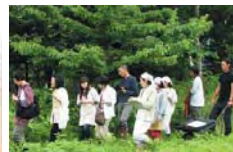
農園散策リフレッシュ