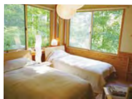
窓から緑があふれます