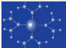
神経ネットワーク