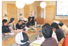
よくわかる脳の仕組み講義

そのために、食事をしっかりとったり、人との関係を良好にして、安定した状態を自分からもできることをやっというと思います。また、意欲を持つことで、人が生きていくための原動力となる欲望がでるという事が分かり、何事も意欲を持ってやる必要があるのだと感じました。講義に参加して、脳内回路のしくみが少しわかった気がするので、そのことを活かしていこうと思います。