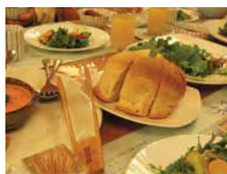
無農薬野菜の手作り料理